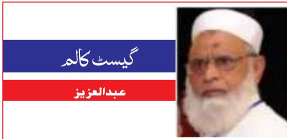
گیسٹ کالم عبدالعزیز

لیے کسی نبی اور کسی کتاب کی حاجت نہیں ہے اور اس دائرے میں جو معمولات مطلوب ہیں انہیں حاصل کرنے کے ذرائع انسان کو دے دیے گئے ہیں۔ دوسری قسم کی چیزیں وہ ہیں جو ہمارے حواس کی پہنچ سے بالاتر ہیں۔ جن کا ادراک ہم کسی طرح نہیں کر سکتے۔ جنہیں نہ متول سکتے ہیں، نہ ناپ سکتے ہیں، نہ اپنے علم کے ذرائع میں سے کوئی ذریعہ استعمال کر کے انہیں معلوم کر سکتے ہیں۔ فلسفی اور سائنس دان ان کے متعلق اگر کوئی رائے قائم کرتے ہیں تو وہ محض قیاس پر مبنی ہوتی ہے جسے عمل نہیں کہا جاسکتا۔ یہ آخری حقیقتیں (Ultimate Realities) ہیں جن کے بارے میں استدلالی نظریات کو خود وہ لوگ بھی یقینی قرار