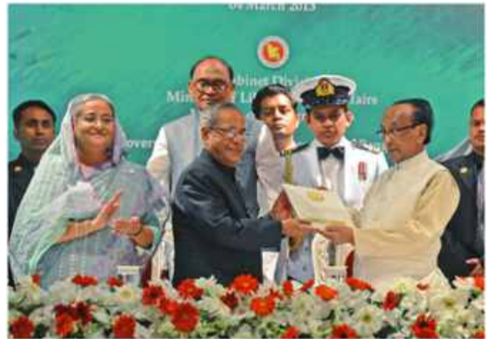
The President, Shri Pranab Mukherjee being presented the Bangladesh Liberation War Honour by the President of Bangladesh, Mr. Md. Zillur Rahman, at Dhaka, Bangladesh on March 04, 2013. The Prime Minister of Bangladesh Mrs. Sheikh Hasina is also seen.

for the crimes they committed during the liberation war of Bangladesh in 1971 triggered a mass uprising against religious fundamentalism. Former Indian Prime Minister Indira Gandhi was posthumously given the same award in July last year. Congress President Sonia Gandhi had received the award on her mother-in-laws behalf. Mr Mukherjee said it was India's first Prime Minister Jawaharlal Nehru who had stated that "where freedom is menaced or justice threatened or where aggression takes place, we cannot be and shall not be neutral". Indira