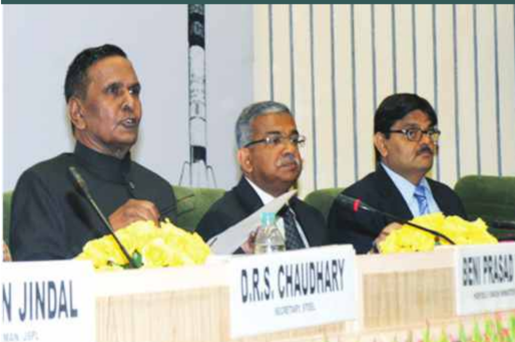
The Union Steel Minister, Shri Beni Prasad Verma addressing at the launch of a book entitled "Indian Saga of Steel", in New Delhi on March 04, 2013