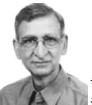
—प्रो॰ राम पुनियानी

अफजल गुरु की अर्ध—गुप्त फांसी (फरवरी २०१३) से कुछ लोगों को धक्का लगा है तो कुछ में जश्न का माहौल है। अफजल गुरु को सुबह—सवेरे फांसी पर लटका दिया गया और उसके शव को जेल के प्रांगण में दफन कर दिया गया। अफजल गुरु के परिवार को उसकी दया याचिका खारिज किए जाने के खिलाफ अपील करने का अवसर नहीं मिला। मौत की सजा की उपादेयता संबंधी प्रश्न कई लोगों के अंतःकरण को झकझोर रहे हैं परंतु शायद वे उस 'सामूहिक अंतःकरण' का हिस्सा नहीं हैं, जो सर्वोच्च न्यायालय के निर्णय और बाद में राष्ट्रपति द्वारा दया याचिका को खारिज किए जाने का आधार बनी। समाज के जिस तबके की सोच यह थी कि अफजल गुरु को फांसी की सजा देना ही गलत था, वह तबका भी शायद देश के 'सामूहिक अंतःकरण' का हिस्सा नहीं था!