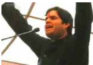
made in two different towns.

verdict, tweeted, "I welcome the decision of the honourable court that upholds my commitment to a strong and united India." Gandhi won his parliamentary election after he spent 19 days in jail. He has denied that the speeches he delivered were designed to incite communal hatred. The cases relate to speeches he