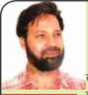
तलवार से तेज़ क्लम की धार

अब बजट तो खर्चा पानी को ही कहते हैं ना जी! साल भर के लिये देश की जनता पर लगने वाली रोकड़ को बजट कहते हैं। मालिक का शुक्र है भारत वर्ष की जनता की रक्षा, सुरक्षा, शिक्षा, स्वास्थ्य कल्याण, पर खर्च होने वाला रोकड़ हर वर्ष बढ़ा दिया जाता है जबकि देश की आमदनी के घटने के समाचार पूरे वर्ष सुनने को मिलते हैं! दुनिया के दस बड़े देशों में हिन्दुस्तान का बजट काफी महत्वपूर्ण माना जाता है उसकी वजह यह है कि हमारे देश में बहुत से धर्म, समुदाय वर्ग व जातियाँ हैं जिसके चलते हर एक को अलग-अलग खुश रखना तथा सभी के कल्याण कारी बजट की तैयारी काफी टेढ़ी खीर है! ज़ाहिर है ऐसे में सरकार और वित्त मंत्री को बजट के सिलसिले में काफी सोच समझकर फ़ैसले लेने थे खासतौर पर जबकि कई अहम राज्यों में विधान सभा तथा केन्द्र में लोक सभा के चुनाव की धार दार