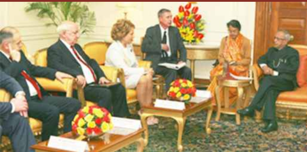
A Parliamentary delegation led by the Chairperson of the Council of Federation, Federal Assembly of the Russian Federation, Mrs. Valentina Matvienko called on the President, Shri Pranab Mukherjee, in New Delhi on February 26, 2013.